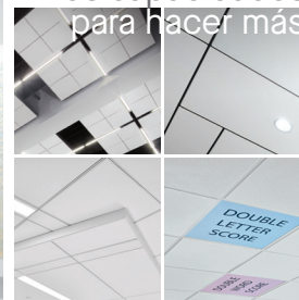
Plafones Ultima® Tegular biselados con sistema de suspensión Silhouette® de 9/16" con ranura de 1/4"

Ver más fotos en: armstrongceilings.com/photogallery