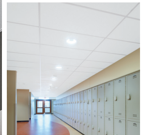
Plafones Fine Fissured™ con sistema de suspensión Prelude® XL® de 15/16"

Ver más fotos en: armstrongceilings.com/photogallery