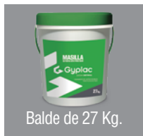
Balde de 27 Kg.