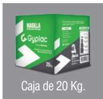
Caja de 20 Kg.