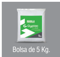
Bolsa de 5 Kg.